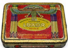
036 - LUXOR

LUXOR ROYALE. Τσίγκινο κουτί 20 τσιγάρων της καπνοβιομηχανίας "Luxor". Διαστάσεις 7,8 x 9,8 x 2 εκ.