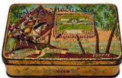
035 - ΤΣΑΝΑΚΛΗΣ ΝΕΣΤΩΡ

Τσίγκινο κουτί 50 τσιγάρων "Cigarettes Queen" της καπνοβιομηχανίας "Nestor Gianaclis Ltd". Διαστάσεις 11,2 x 8,6 x 3,2 εκ.